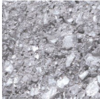
130 Noors Grijs