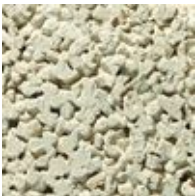
326 Noors Room