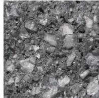
131 Noors Antraciet