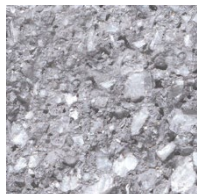
130 Noors Grijs