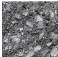
131 Noors Antraciet