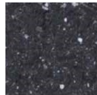
848 Basalt Charcoal