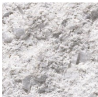
525 Noors Wit

Standaard kleuren (zie blad 1 voor de voorraadkleuren!)