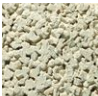
326 Noors Room