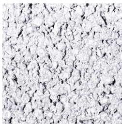
WIT KLEURCODE: 584