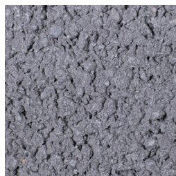
GRIJS KLEURCODE: 197