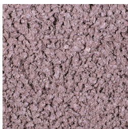
HEIDEPAAARS KLEURCODE: 496