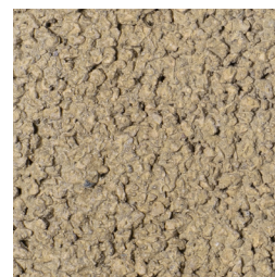
GEEL KLEURCODE: 395