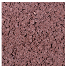
ENGELS ROOD KLEURCODE: 494