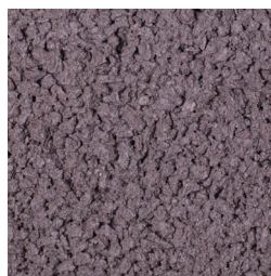
HEIDEMANGAAN KLEURCODE: B17