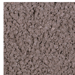
BRUIN KLEURCODE: 294