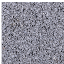
GRIJS KLEURCODE: 165