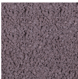
HEIDEMANGAAN KLEURCODE: B78