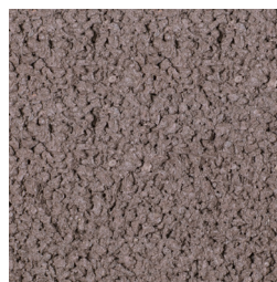
BRUIN KLEURCODE: 232