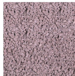
HEIDEPAAARS KLEURCODE: 472