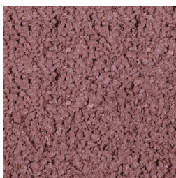
ENGELS ROOD KLEURCODE: 474