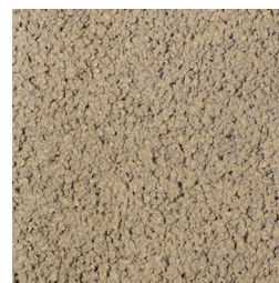
GEEL KLEURCODE: 394