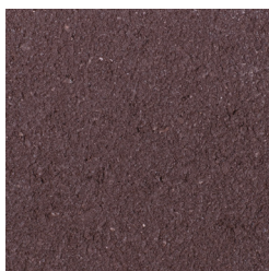
DOORNBURGH DONKERROOD KLEURCODE: 863