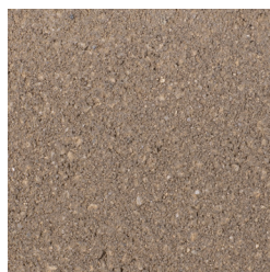
DUURSTEDE DONKERGEEL KLEURCODE: 389