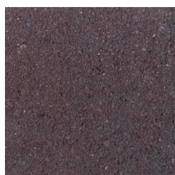
ARCEN ROOD-ZWART KLEURCODE: 465