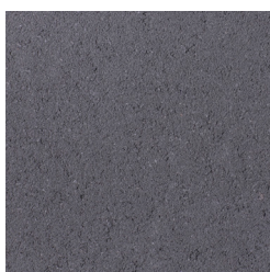
GRAUWAART DONKERGRIJS KLEURCODE: A18