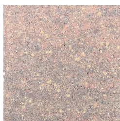
OCKENBURGH HERFST NUANCE KLEURCODE: 923