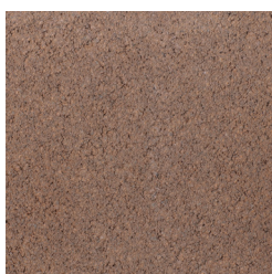
DUSSEN LICHTBRUIN KLEURCODE: 299