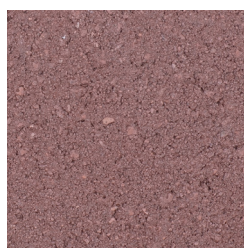
MALBERG ROOD KLEURCODE: 813