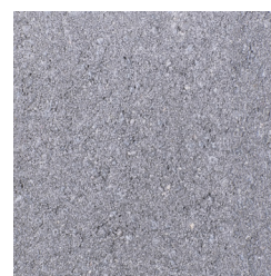
IJSSELSTEIN LICHTGRIJS KLEURCODE: 124