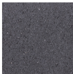
HORN ANTRACIET KLEURCODE: 181