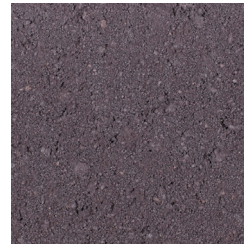
HEIDEMANGAAN KLEURCODE: B78