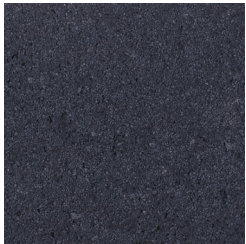
BASALTZWART KLEURCODE: 195