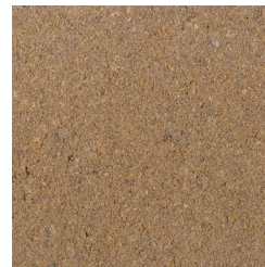
DONKERGEEL KLEURCODE: 390