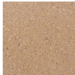
OKERGEEL KLEURCODE: 392