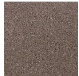
DONKERBRUIN KLEURCODE: B91