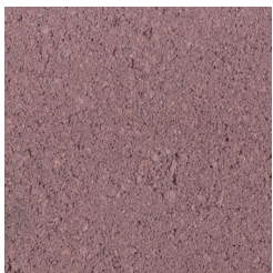
ENGELS ROOD KLEURCODE: 494