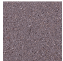
DONKERPAAARS KLEURCODE: 400