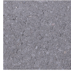
GRIJS KLEURCODE: 197