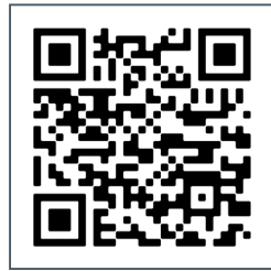
SCAN DE QR-CODE VOOR ALLE KLEUREN

KLEUREN ZIJN INDICATIEF, OVERIGE KLEUREN EN PROJECTSPECIFIEKE DESIGNS OP AANVRAAG.