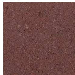
DONKERROOD KLEURCODE: 490