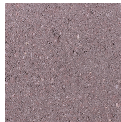
HEIDEPAAARS KLEURCODE: 496