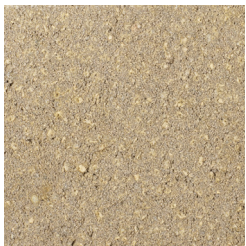
GEEL KLEURCODE: 395