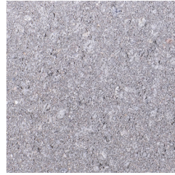
ARDUINGRIJS KLEURCODE: 185