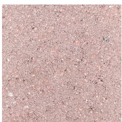
LICHTBRUIN KLEURCODE: 203