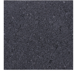
ANTRACIET KLEURCODE: 182