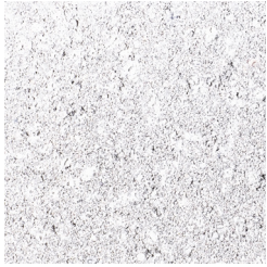
WIT KLEURCODE: 505