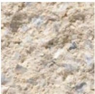
326 Noors Room