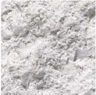
525 Noors Wit

Couleurs standard (voir page 1 pour les couleurs en stock !)