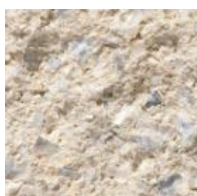
326 Noors Room